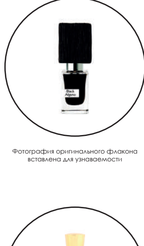
Фотография оригинального флакона источником для узнаваемости

Black Afgano Nasomatto — это аромат для мужчин и женщин, он принадлежит к группе древесные фужерные. Парфюмер: Alessandro Gualtieri. Верхние ноты: Конопля и Зеленые ноты; Средние ноты: Сикоя, Древесные ноты, Табак и Кофе; Базовые ноты: Уд и Ладан.