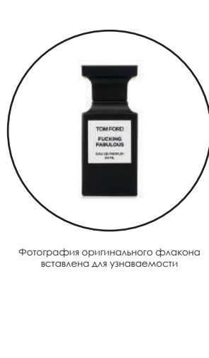
Фотография оригинального флакона источником для узнаваемости