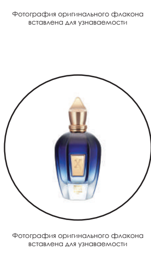
Фотография оригинального флакона источником для узнаваемости

Tuscan Leather Tom Ford — это аромат для мужчин и женщин, он принадлежит к группе кожаные. Tuscan Leather выпущен в 2007 году. Верхние ноты: Малина, Шафран и Чабрец; Средние ноты: Олибанум и Жасмин; Базовые ноты: Кожа, Замша, Древесные ноты и Амбра.