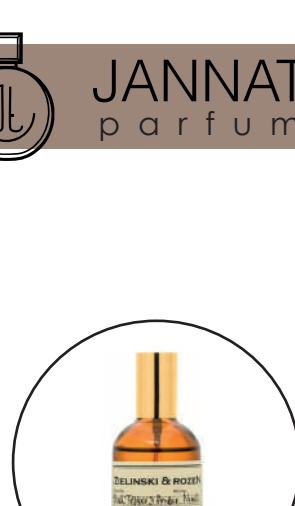
Фотография оригинального флакона источником для узнаваемости