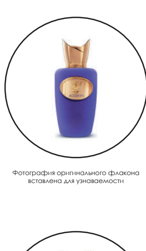
Фотография оригинального флакона источником для узнаваемости