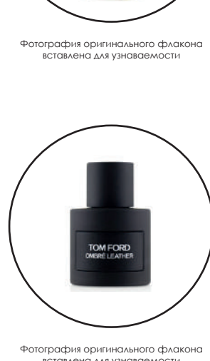
Фотография оригинального флакона источником для узнаваемости

More Than Words Eau de Parfum Xerjoff, выпущенный в 2012 году, классифицируется как унисекс-аромат и принадлежит семействам Древесные и Цветочные. More Than Words Eau de Parfum входит в коллекцию Join The Club. Состав композиции: Композицию составляют следующие ноты и аккорды: Цветочные ноты, Древесный аккорд, Фруктовый нота, Лобданум, Ладан, Серая амбра и Восточные ноты.