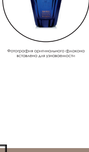
Фотография оригинального флакона источником для узнаваемости

Lost Cherry — насыщенный аромат, открывающий двери в некогда запретный мир. Его соблазнительная двойственность основана на контрасте ириной, блестящей и гладкой изнанки с сочной мякотью внутри. — Том Форд. Насыщенный и изысканный восточный аромат Lost Cherry пронизан контрастами.