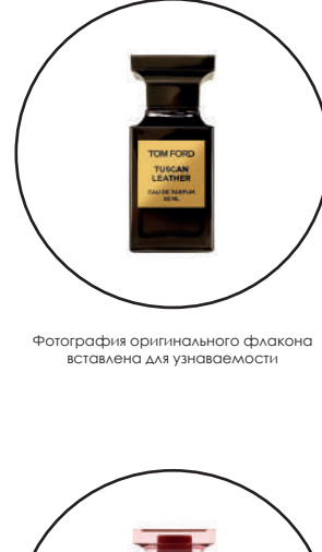
Фотография оригинального флакона источником для узнаваемости