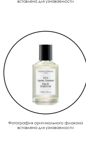
Фотография оригинального флакона источником для узнаваемости

Важная незабываемый букет данного парфюма, его обладатель словно переносится устремлениями и ощущениями в чарующую страну исполнения желаний. Нотами шлейфа Xerjoff More Than Words являются амбра, уд, цветочные ноты, лобданум, фруктовые ноты, древесные ноты, ладан и восточные ноты.