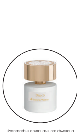
Фотография оригинального флакона источником для узнаваемости