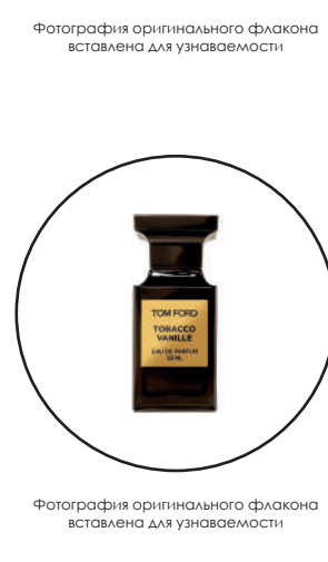
Фотография оригинального флакона источником для узнаваемости