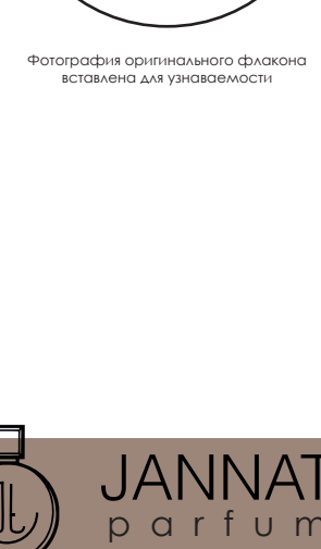
Фотография оригинального флакона источником для узнаваемости

Nejma 7 Nejma — это аромат для мужчин и женщин, он принадлежит к группе восточные гурманские. Nejma 7 выпущен в 2014 году. Парфюмер: Alice Lavenat. Верхние ноты: Розовый грейпфрут, Зеленый мандарин и Калабрийский бергамот; Средние ноты: Кокос, Какао и Нероли; Базовые ноты: Уд, Пачули и Белый мускус.