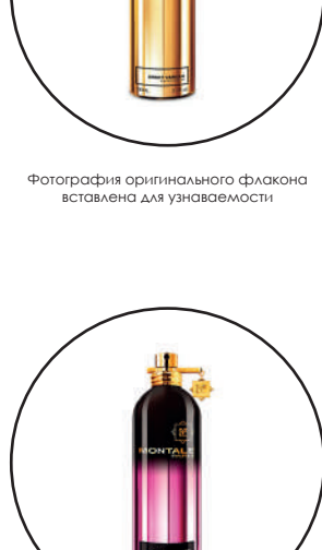
Фотография оригинального флакона источником для узнаваемости

Starry Night Montale — это аромат для мужчин и женщин, он принадлежит к группе восточные цветочные. Starry Night выпущен в 2015 году. Парфюмер: Pierre Montale. Верхние ноты: Яблоко, Бергамот и Лимон; Средние ноты: Роза, Пачули и Жасмин; Базовые ноты: Белый мускус, Пудровые ноты и Амбра.