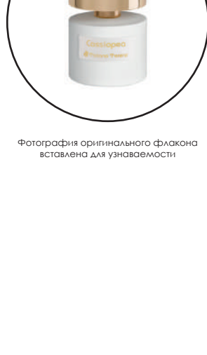
Фотография оригинального флакона источником для узнаваемости