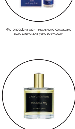
Фотография оригинального флакона источником для узнаваемости