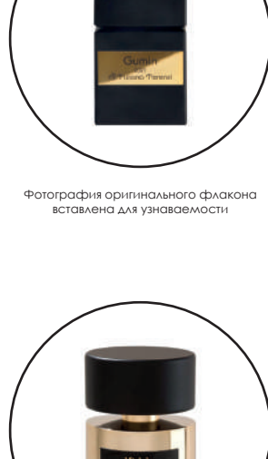
Фотография оригинального флакона источником для узнаваемости

Cassiopea выпущен в 2015 году. Парфюмер: Paolo Terenzi. Верхние ноты: Мараккуя, Лист черной смородины, Лимон и Папоротник; Средние ноты: Гвоздика (цветок), Ландыш и Чайная роза; Базовые ноты: Бобы тонка, Мускус и Санда.