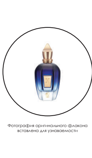
Фотография оригинального флакона источником для узнаваемости

Tobacco Vanille Tom Ford — это аромат для мужчин и женщин, он принадлежит к группе восточные пряные. Tobacco Vanille выпущен в 2007 году. Парфюмер: Olivier Gilloff. Верхние ноты: Аист табака и Пряности; средние ноты: Ваниль, Какао, Бобы тонка и Цветок табака; базовые ноты: Сухофрукты и Древесные ноты.